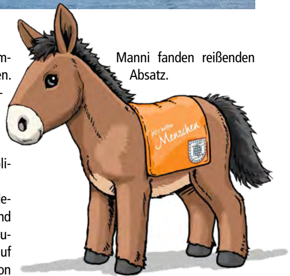
Manni fanden reißenden Absatz.

Die Veranstaltung bot zahlreiche atemberaubende Shows und Vorführungen. Darunter auch die Präsentation der Gebirgsjäger auf dem Reitplatz, die vom Publikum mit tosendem Applaus aufgenommen wurde. Die Tragtierführer stellten ihre Ausrüstung vor und gaben Einblicke in den Tagesdienst. Danach strömten die begeisterten Pferdefreunde zum Stand von Bundeswehr und Härtefallstiftung. Dort konnten die Besucher nicht nur mit den echten Mulis auf Tuchfühlung gehen. Auch die Stofftiere von