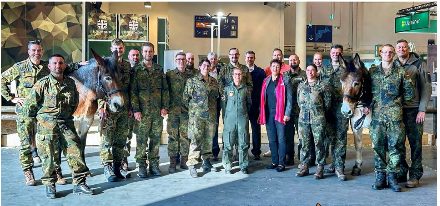
Das Team des Messestandes BAPersBw mit den Mulis Gundi und Manni

Essen. Zehntausende Besucher waren bei der weltgrößten Pferdesportmesse „Equitana“ zu Gast. Da durfte Manni, das behufte Patentier der Härtefallstiftung, nicht fehlen. Unter den 600 Ausstellern war auch die Bundeswehr gemeinsam mit der Härtefallstiftung mit einem Messestand vertreten. Dabei erwiesen sich die Maultiere Manni und Gundi vom Einsatz- und Ausbildungszentrum für Tragtierwesen 230 in Bad Reichenhall als wahre Publikumsmagneten.